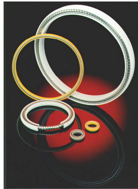
Bild 3 Metалldichtungen