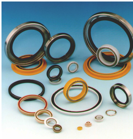
Bild 2 Federelastische PTFE-Dichtungen